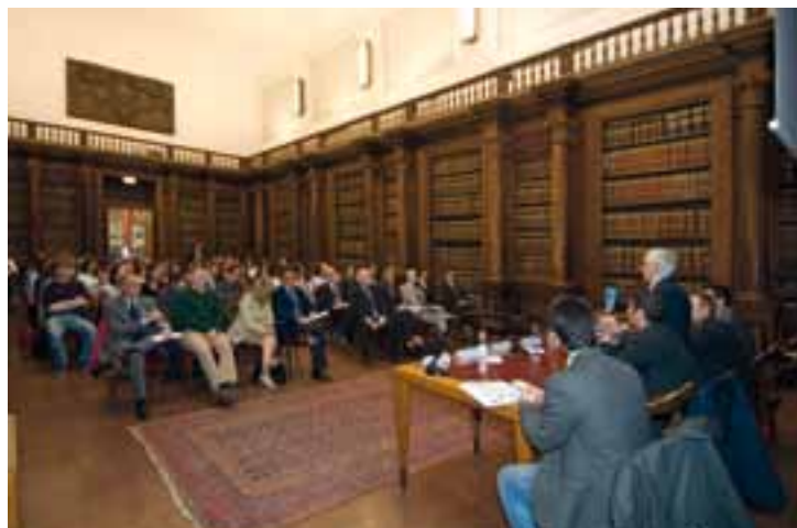
Un momento della premiazione di Mimpredo Padova.

L'iniziativa rappresenta un "valore aggiunto" per le aziende coinvolte, dal momento che ogni azienda potrà avvalersi per 6 mesi della collaborazione di un team di laureandi o laureati impegnati nello sviluppo di una idea innovativa dell'imprenditore.